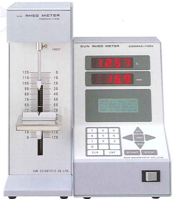
SUN RHEO METER COMPAC-100 II

食品、医薬品、化粧品他、多くの工業製品の原料から製品までの品質は、硬さ、軟らかさ、粘性、弾性、脆さ、粘着性、引張り強度、応力緩和などの物理的性状が評価の重要な要素になります。『sunレオメーター COMPAC-100 II』は、それらの試験を簡単かつ高精度に行うことができる、コンパクトタイプの総合物性測定器です。